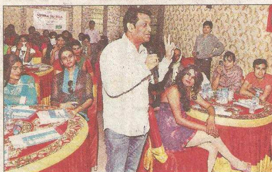
Participants at a workshop organised for transgender community, in Patna on Friday.